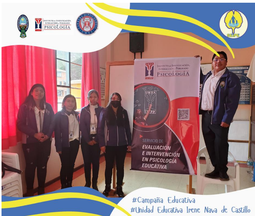
Equipo SEIPE en la Campaña Educativa dentro de la Unidad Educativa Irene Nava de Catillo.