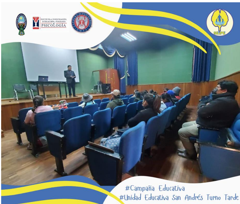
#Campaña Educativa #Unidad Educativa San Andrés Turno Tarde