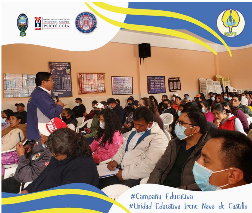
Exposición en la campaña Educativa en la Unidad Educativa Irene Nava de Catillo.