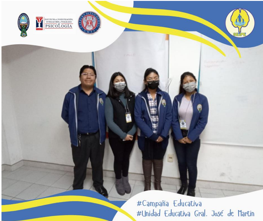
#Campaña Educativa #Unidad Educativa Gral. José de Martín