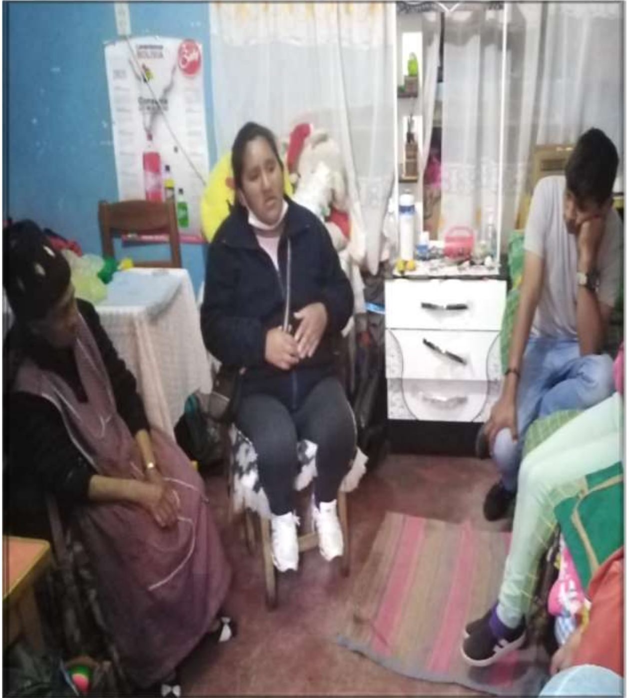
FOTOGRAFIA DE SEGUIMIENTO