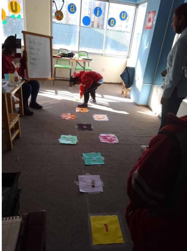
Anexo 16 actividades del plan de trabajo