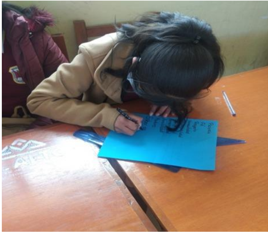
Anexo 18 actividades del plan de trabajo