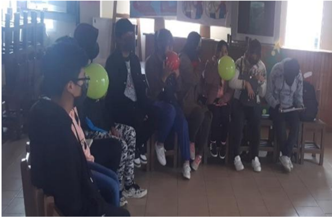
Anexo 14 actividades del plan de trabajo