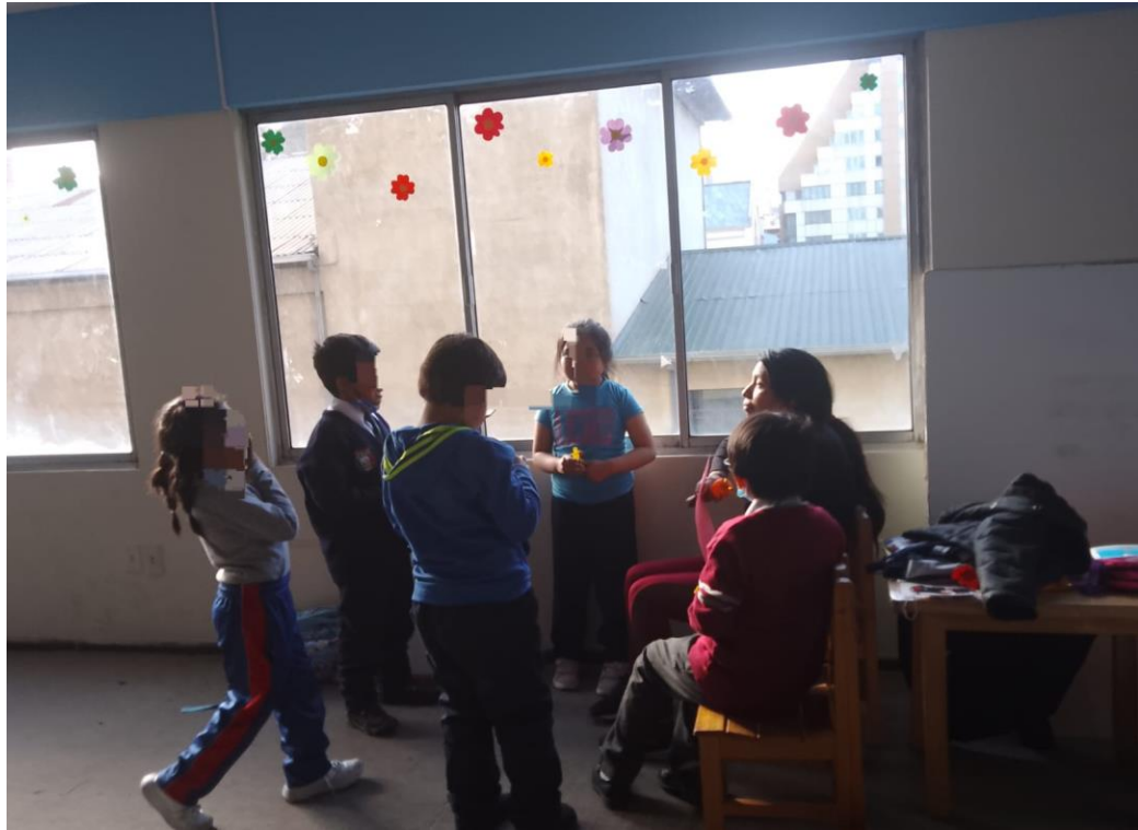
Anexo 20 actividades del plan de trabajo