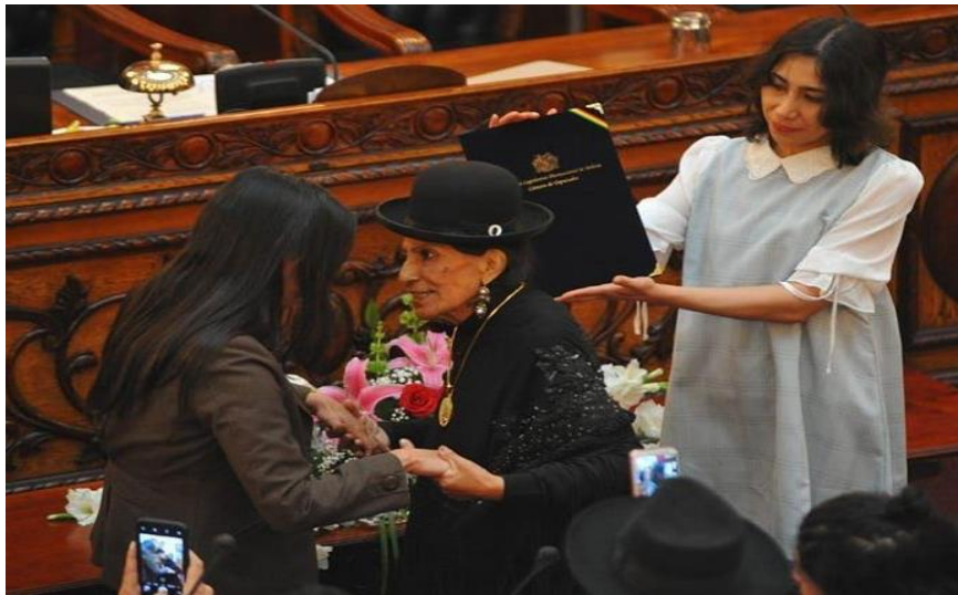
REMEDIOS LOZA (+) RECONOCIDA POR LA CAMARA DE DIPUTADOS (2018)