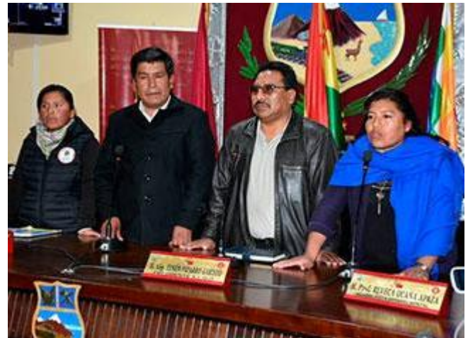
MUJERES LLEGAN A LA VICEPRESIDENCIA 2017