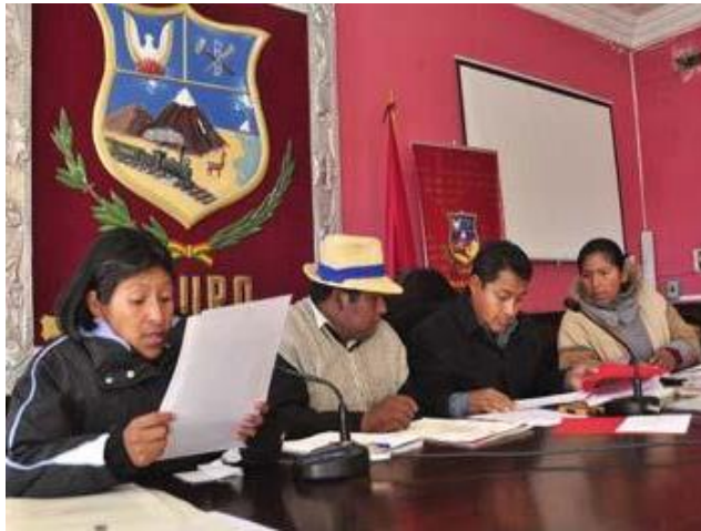
PRIMERA LEGISLATURA 2015