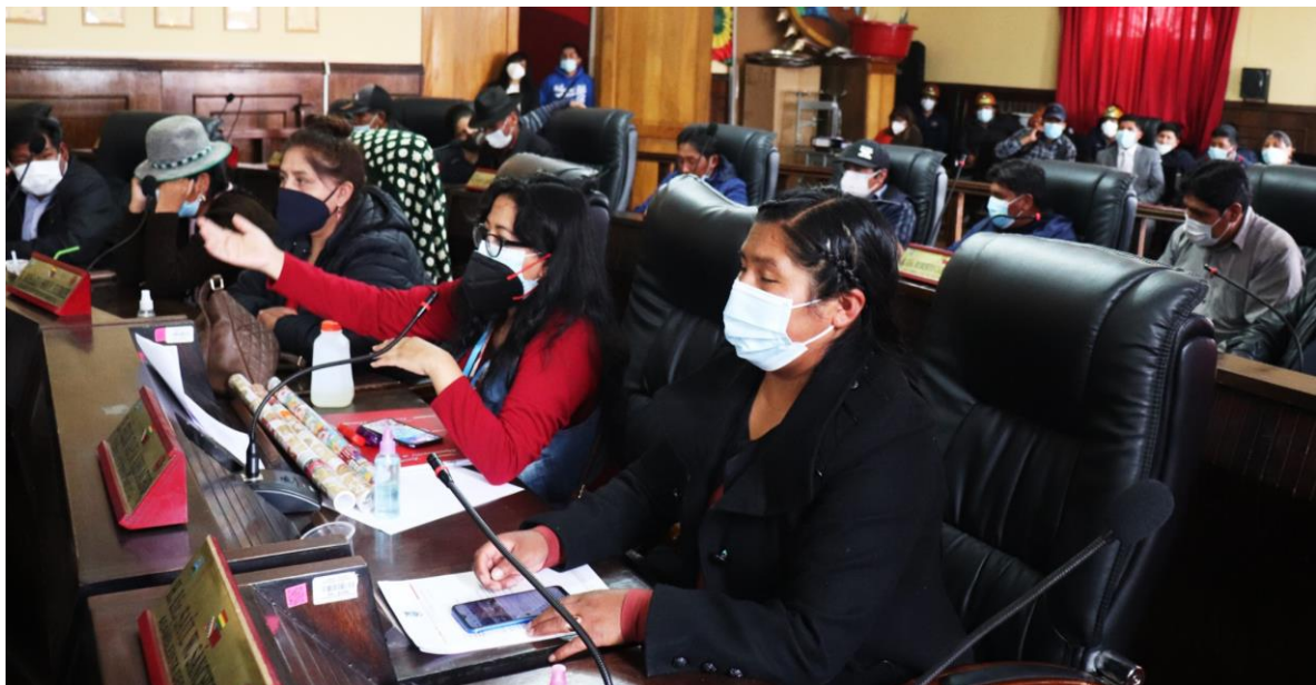
POCAS OPORTUNIDADES DE PARTICIPACIÓN DE LAS MUJERES EN SESIONES DEL A.L.D.O.