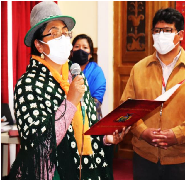
MUJERES ASAMBLEISTAS RECONOCEN POR APOYAR LA LUCHA CONTRA LA VIOLENCIA HACIA LA MUJER.