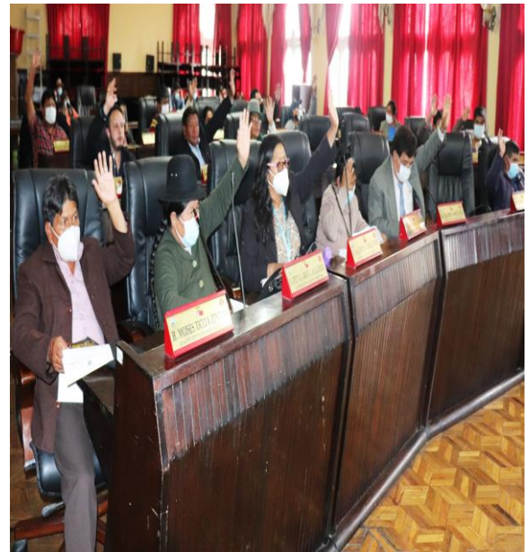
9 MUJERES DE 33 VARONES ASAMBLEISTAS