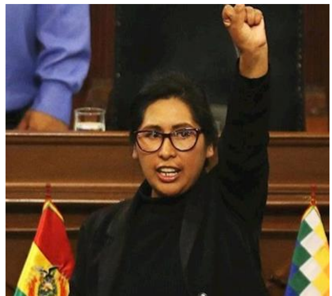
EVA COPA PDTA. CAMARA DE SENADORES BOLIVIA (2019)