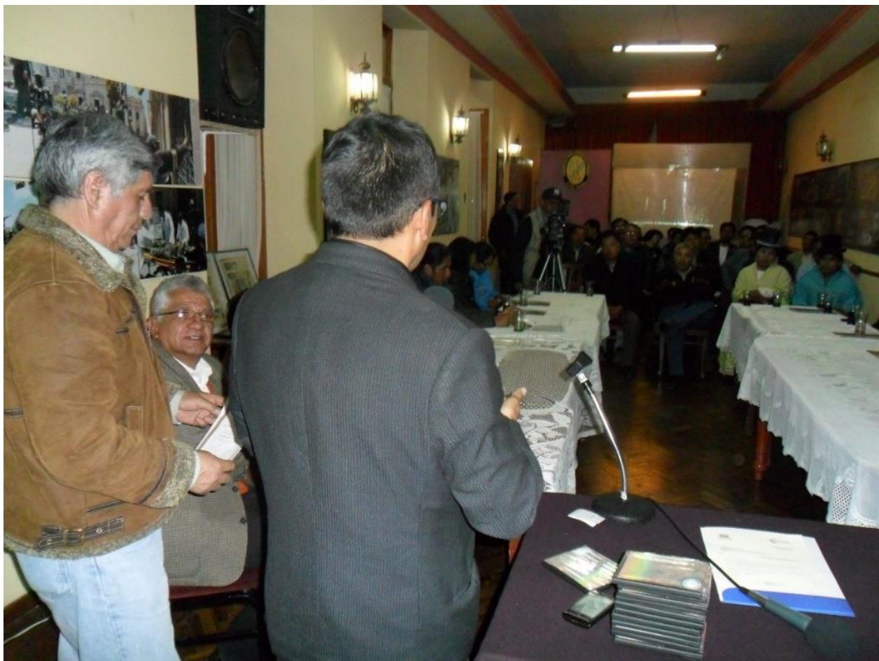
Reunión de afiliados de la FTPLP en la cual se dio a conocer la situación de emisora y los pasos que se estaban siguiendo. En la ocasión se presentó los discos compactos con los conversatorios efectuados previamente en el marco de la conmemoración del aniversario de la institución.