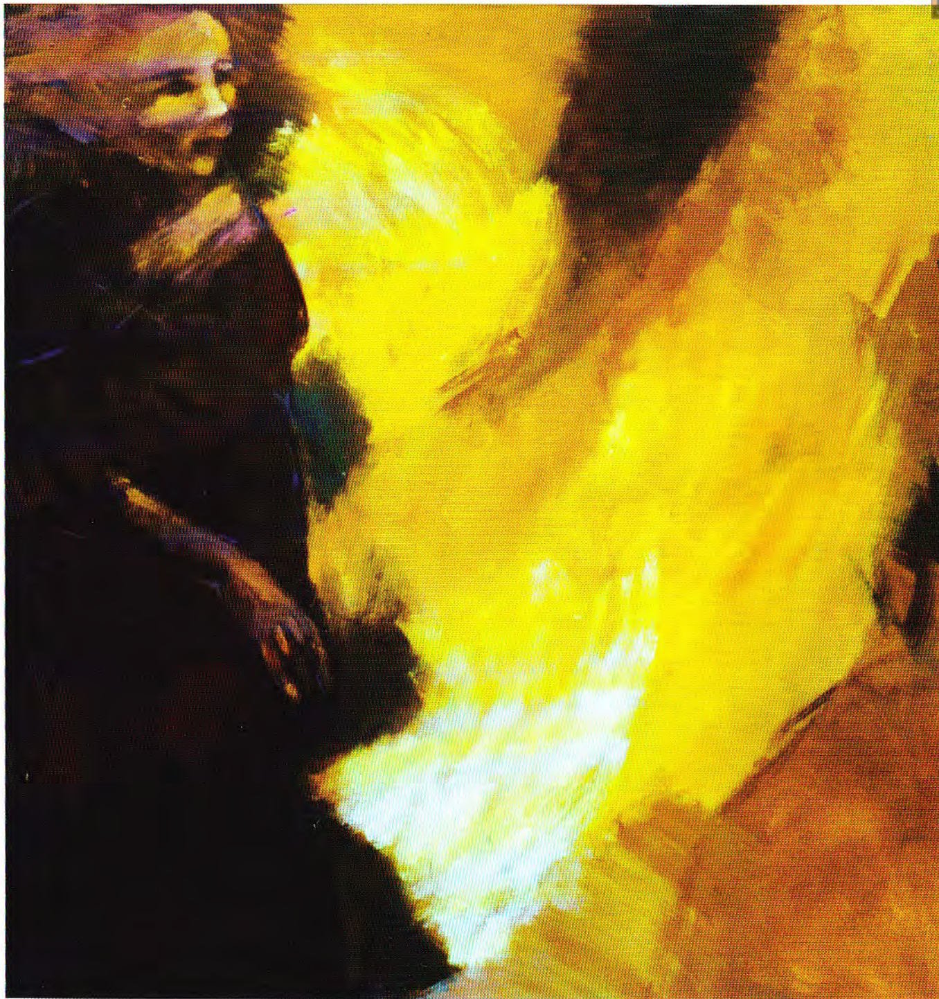
Manina Lara "Rumor de ciudad" óleo sobre lienzo (132X120)