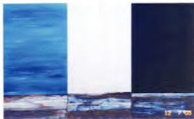
Raquel Schwartz Pasajes áridos II, III y IV óleo 150 x 90 cm, c/c.