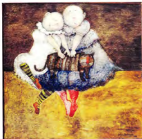
Graciela Rodo Boulanger Double Portrait, óleo/tela 100 x 100 cm.