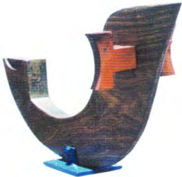
Francine Secretan Secreto compartido madera y metal 36 x 64 x 20 cm.