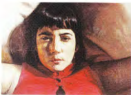
Alex Zapata Sin título óleo/tela 23 x 25 cm.