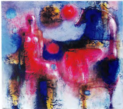
Fabricio Lara Bailarina y ecuestrs acrílico/madera 53 x 53 cm.