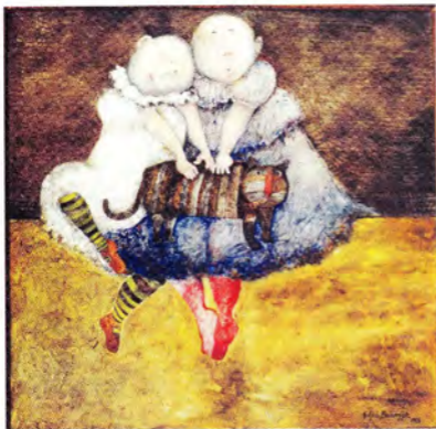
Graciela Rodo Boulanger Double Portrait óleo/sela 100 x 100 cm.