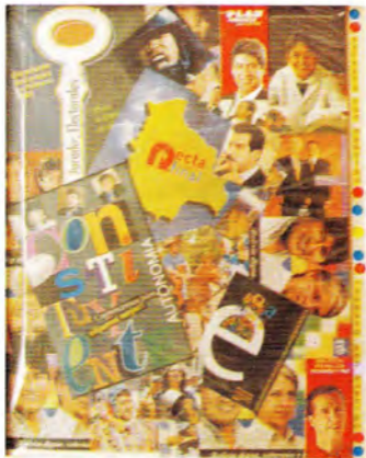
Alfredo La Placa Secreto con-partido collage 78 x 60 cm.