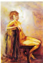
Ricardo Pérez Alcalá Baño de luz óleo/tela 40 x 42 cm.