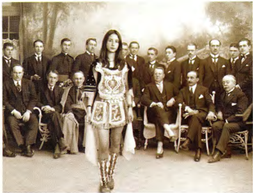
Sol Mateo Ana y los lobos fotografía digital 200 x 260 cm.