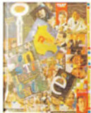
Alfredo La Placa Secreto con-partido collage 78 x 60 cm.