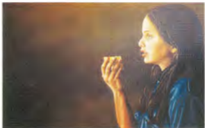
Giomar Mesa Secretos dióxido 100 x 250 cm. óvalo