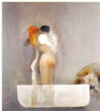
Gustavo Lara Secreto óleo sobre tela 100 x 80 cm.