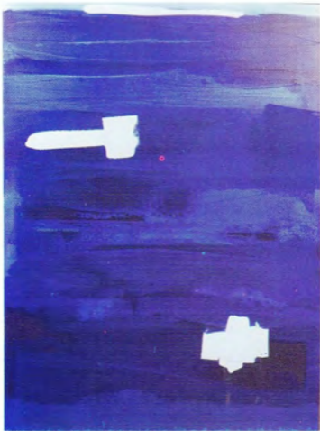
Cecilia Lampo El lenguaje del color azul acrílico/tela 120 x 90 cm.