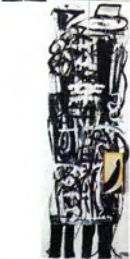
Keiko Gonzalez Cuatro mentiras acrílico sobre tela 95 x 74 cm. acrílico/madera 180 x 90 cm.