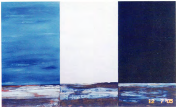
Raquel Schwartz Paisajes ácidos II, III y IV mixta 150 x 80 cm. c/u