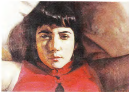
Alex Zapata Sin título óleo/tela 20 x 25 cm.