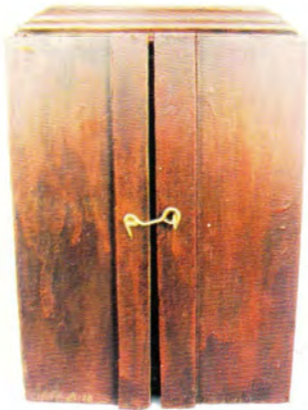
Gastón Ugalde Secreto compartido madera y técnica mixta/madera 30 x 20 x 20 cm.