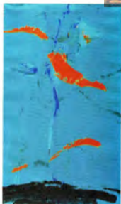
Angeles Fabri Arbol acrilico/tela 192 x 93 cm.