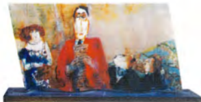
Ejti Stih Sin título acrílico/madera 48 x 81 cm.