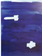
Cecilia Lampo El lenguaje del color azul acrílico sobre tela 120 x 90 cm.