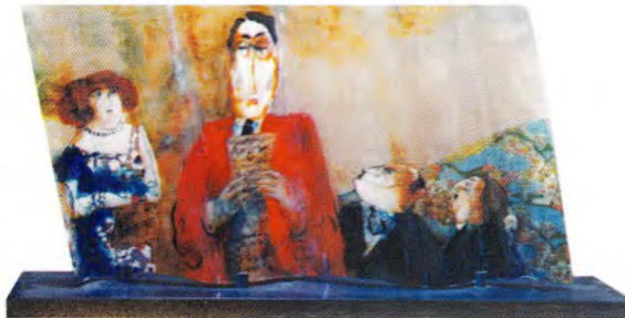
Eji Stih Sin título acrilico/resina 48 x 83 cm.