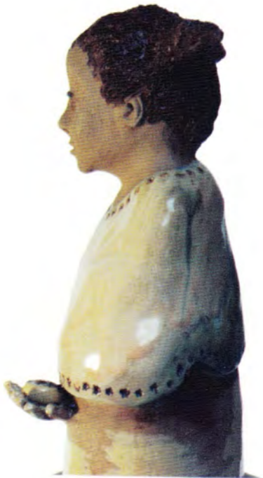
Patricia Murillo Secreto compartido I modelado en gris y esmalte 50 x 16 x 16 cm.