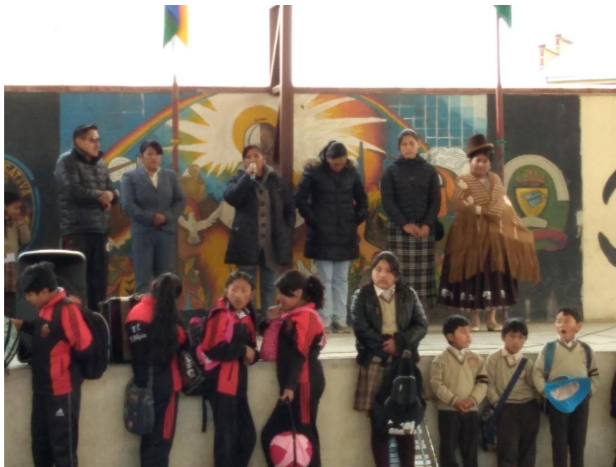
Presentación del Consejo Educativo a la comunidad educativa