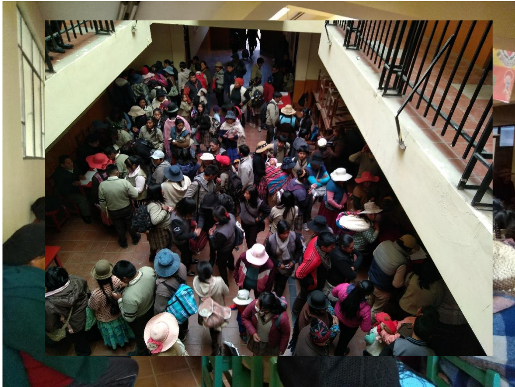
SEMINARIO ESCUELA DE PADRES