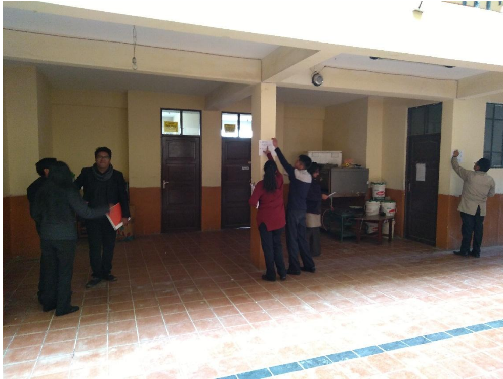
LUGARES DE LA ENTREVISTA POR ÁREAS