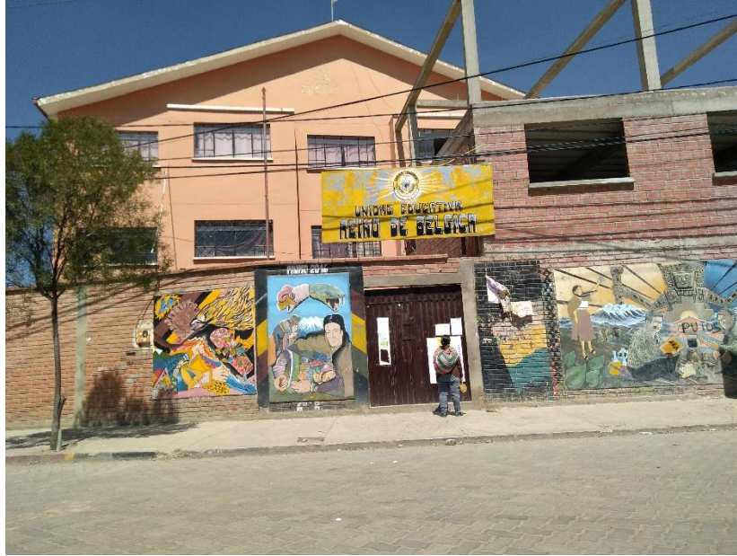
Vista de frente la Unidad Educativa Reino de Bélgica