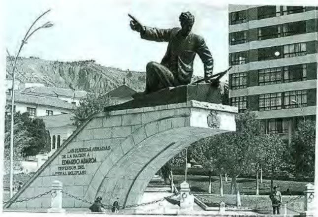
Héroe del Topáter, Eduardo Abaroa Bronce La Paz 1951