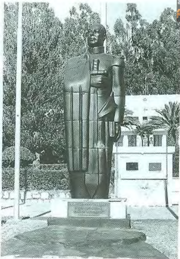
Presidente Cnl. Gualberto Villarroel Piedra basalto Colegio Militar, La Paz 1963