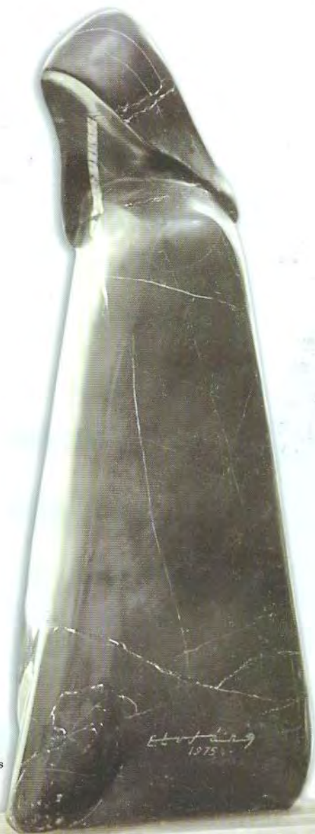
Jilakata Mármol 42x19x17 cms 1975