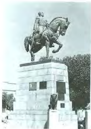
Monumento ecuestre al vencedor de Ingavi, Gral. José Ballivián Bronce Plaza de Viacha. La Paz 1962