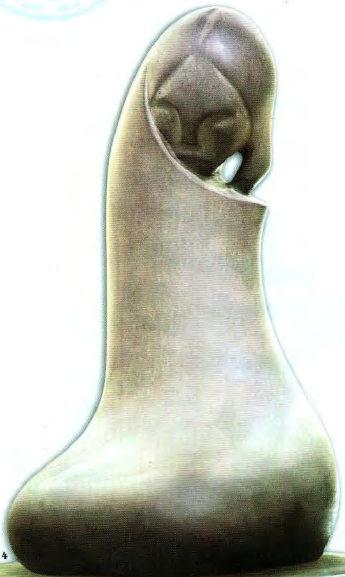
Adolescente aymara Asperón rojo 38x22x23 cms 1959

DOCUMENTO DIGITALIZADO POR LA BIBLIOTECA DE LA CARRERA DE ARTES PLASTICAS - UMSA