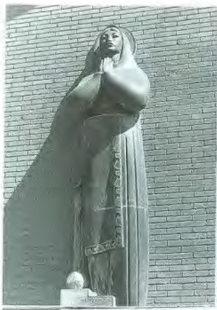
Virgen india Piedra basalto Villa Victoria. La Paz 1954