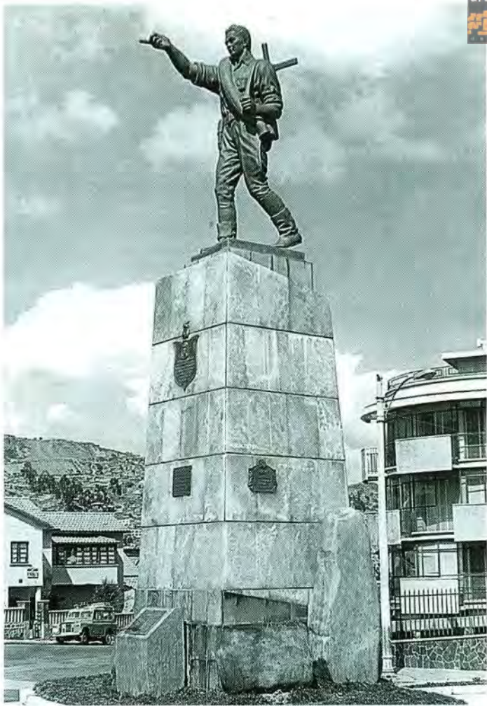
Presidente Tcnl. Germán Busch Bronce La Paz 1968