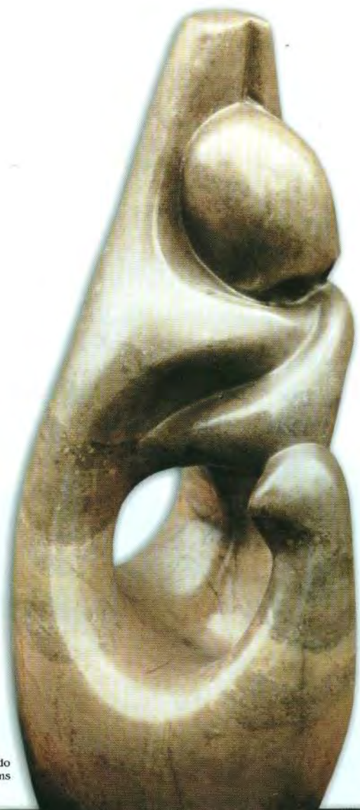
Chullpa Mármol rosado 60x28x26 cms Sin fecha