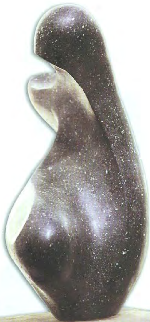
Madre India Mármol verde 37x21x22 cms 1959