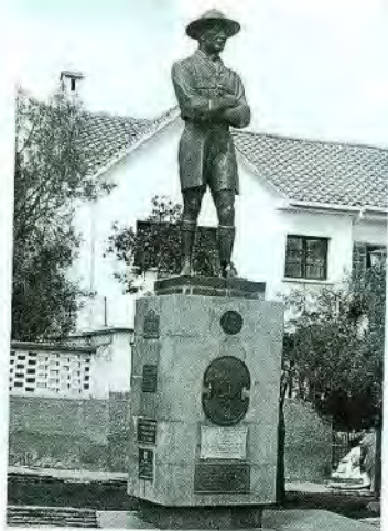
Baden Powell Bronce Miraflores, La Paz 1965