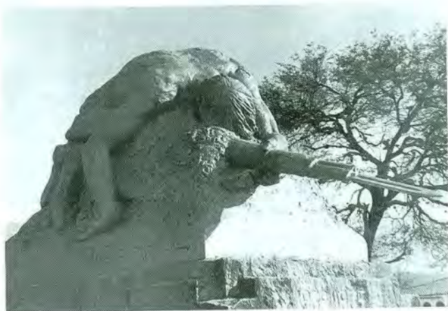
Soldado desconocido Cemento patinado Villamontes 1942