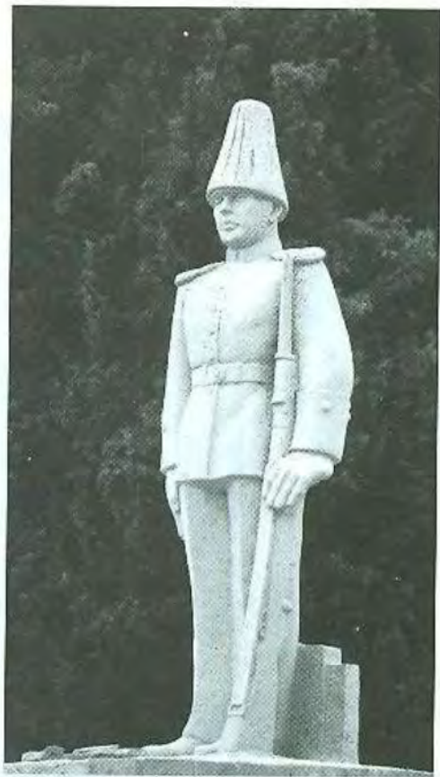
Monumento al cadete Piedra comanche Colegio Militar, La Paz 1974