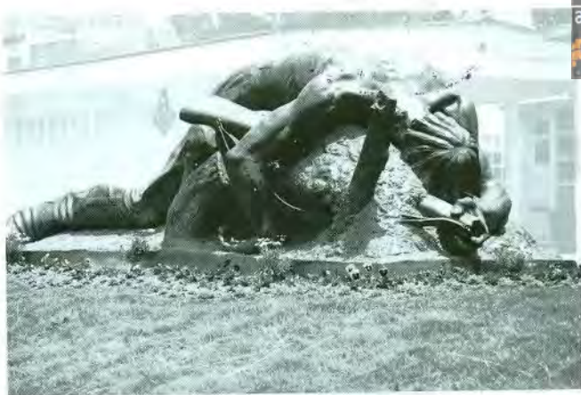
Soldado desconocido Bronce Cementerio, La Paz 1972