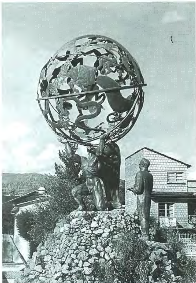
Alejandro von Humboldt Bronce La Florida, La Paz 1967