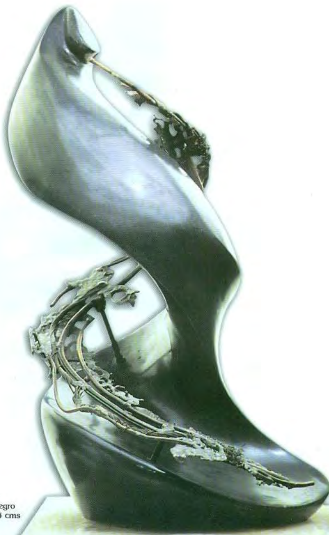
En órbita Basalto negro 73x42x34 cms 1963