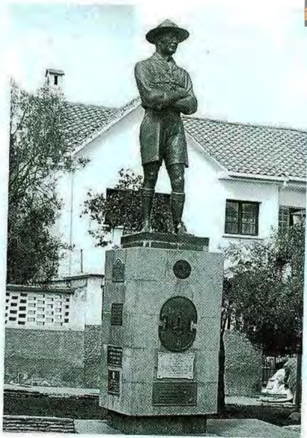
Baden Powell Bronce Miraflores, La Paz 1965