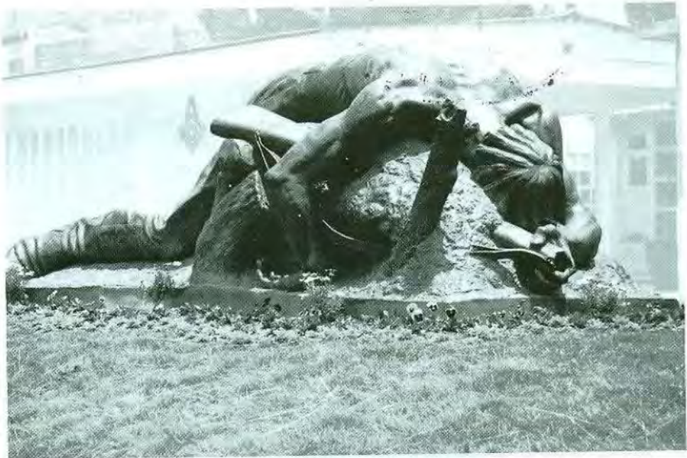
Soldado desconocido Bronce Cementerio, La Paz 1972