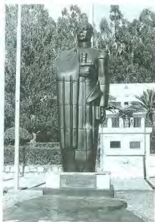
Presidente Cnl. Gualberto Villarroel Piedra basalto Colegio Militar, La Paz 1963