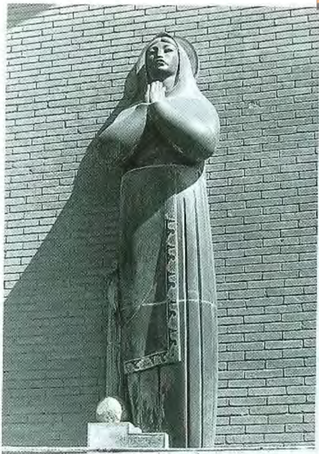
Virgen india Piedra basalto Villa Victoria, La Paz 1954