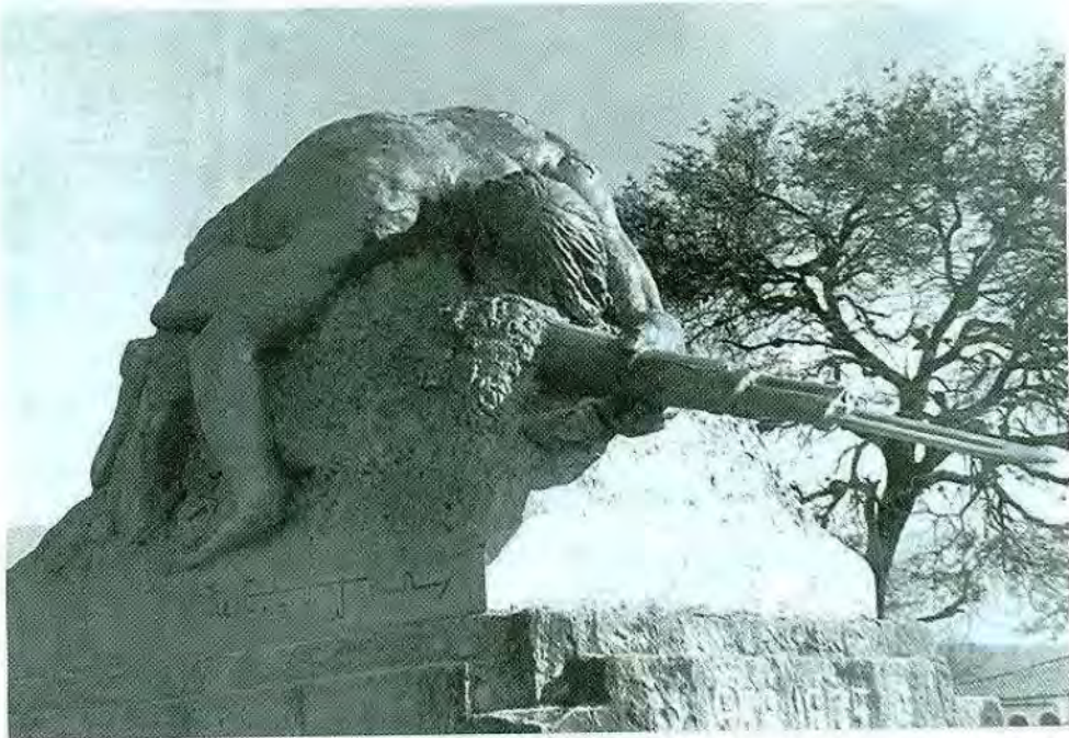
Soldado desconocido Cemento patinado Villamontes 1942