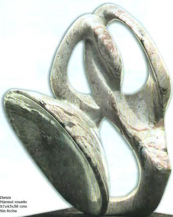
Danza Mármol rosado 57x43x38 cms Sin fecha