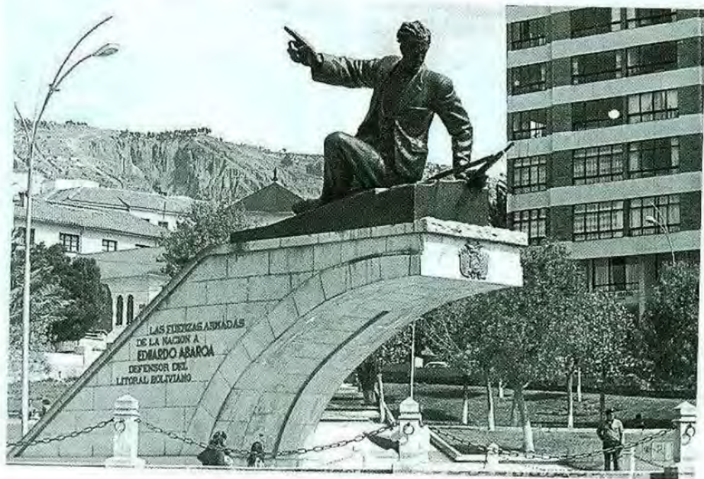
Héroe del Topáter, Eduardo Abaroa Bronce La Paz 1951