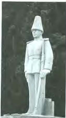
Monumento al cadete Piedra comanche Colegio Militar, La Paz 1974