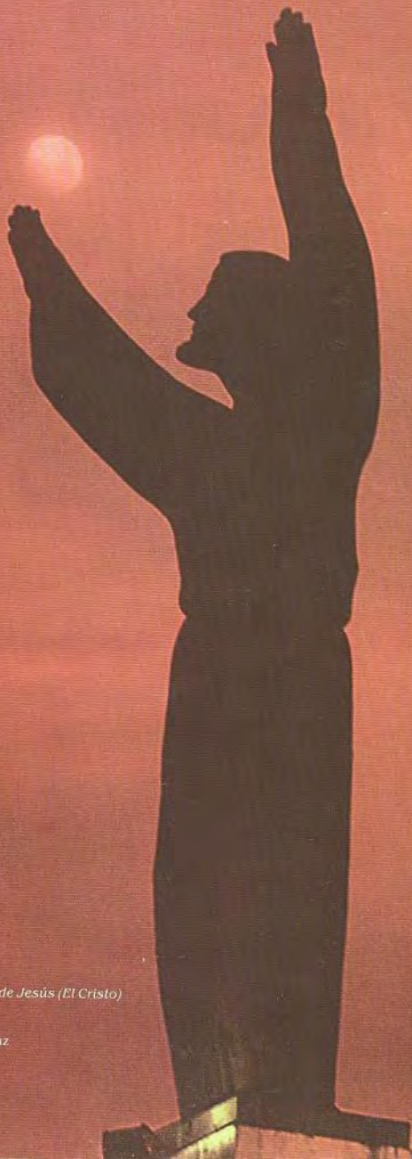
Corazón de Jesús (El Cristo) Bronce 8 m Santa Cruz 1961