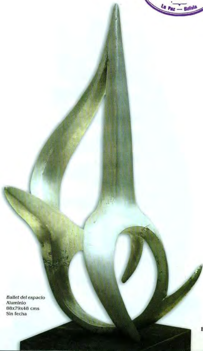
Ballet del espacio Aluminio 88x79x48 cms Sin fecha