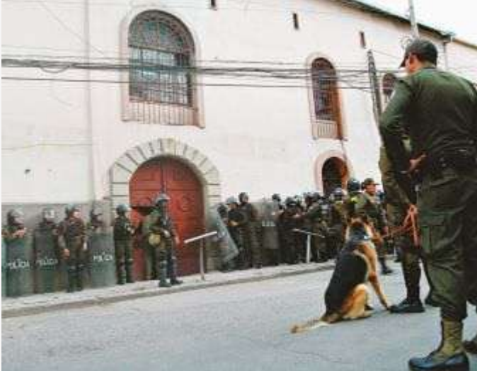
Vigilancia. Un grupo de policías resguarda la cárcel de San Pedro de La Paz, durante un motín, este año.