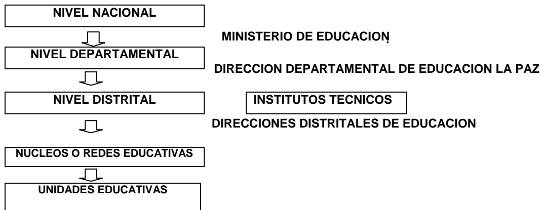
DIAGRAMA de la Estructura de Administración Curricular

La Estructura de Administración Curricular constituye la línea de autoridad dentro del Sistema Educativo Nacional (SEN), ya que sus objetivos, fijados por el Código de la Educación, son: garantizar el desempeño de la más alta función del Estado, generando un ambiente adecuado y condiciones propicias para que los actores de la educación logren sus objetivos con eficiencia; planificar, organizar, orientar y evaluar el proceso educativo en todas las áreas, niveles y modalidades del sistema, facilitando y promoviendo la participación popular en todo el proceso educativo. En el nivel nacional se encuentra la estructura del Ministerio de Educación cuya jurisdicción y competencia abarca a todo el territorio nacional, con funciones eminentemente normativas.