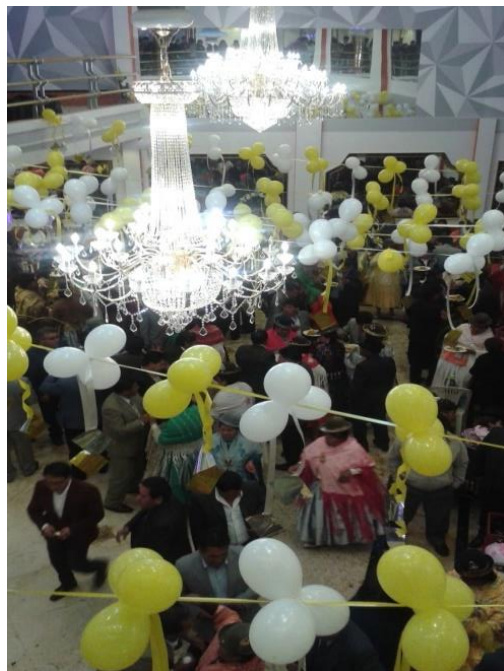
Ritual de la ch'alla por la inauguración del salón “El Dorado”.

La foto 4.6 muestra el ritual de la ch'alla del día de la inauguración de un salón para fiestas diseñado con la arquitectura “andino-moderna”. Su propietario indicó que esta es su tercera edificación con este tipo de diseño. Él es un comerciante que importa mercadería de varios países, principalmente asiáticos. Las luces y la pantalla que se observan en la foto 4.6 fueron traídas exclusivamente para este salón. Su dueño con mucho orgullo expresó: “ Aquí está asegurada hasta cinco generaciones ”. El brillo y los colores de este salón representan el estatus social, la alcurnia y el poder económico de su dueño.