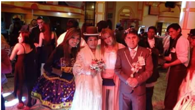
Ritual de la ch'alla a un edificio de arquitectura “andino-moderna”.

La foto 4.5 corresponde al día de la ch'alla de un edificio “andino-moderno”. Este ritual está integrado por varios momentos. La ofrenda a la pachamama se inicia en el “espacio ritual” de la vivienda, y luego se recorre cada una de las habitaciones, salones y tiendas de la edificación. Después de una misa de agradecimiento y bendición, comienza el festejo a nombre de la familia dueña de casa. Durante la ofrenda a la pachamama, se pide por la perdurabilidad del edificio y el negocio próspero.