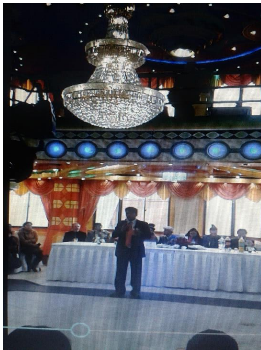
El arquitecto Freddy Mamani Silvestre, primer exponente de la arquitectura “andino-moderna”.