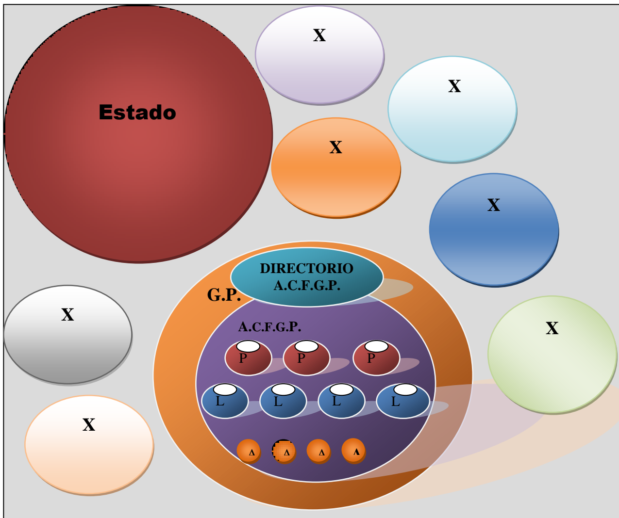
Fuente: Elaboración propia. Fig. 1 Representación de la composición de esferas de poder en el sector del Gran Poder.

X= Esferas distintas de poder o elites en la sociedad.