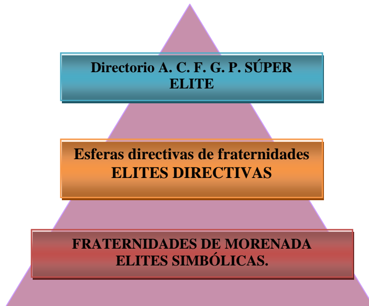
FIG. 2 Representación de la estructura interna en forma piramidal de la elite del Gran Poder.

Posteriormente las elites dirigenciales, ubicadas en las fraternidades y en la A.C.F.G.P., cuyos cargos permiten la dirigencia basada en un grado de poder decisivo y regular. Posteriormente la relación entre las elites simbólicas, compuestas en el análisis, por las fraternidades de morenada, gracias al desarrollo de redes de poder que presentan frente a las danzas livianas y autóctonas.