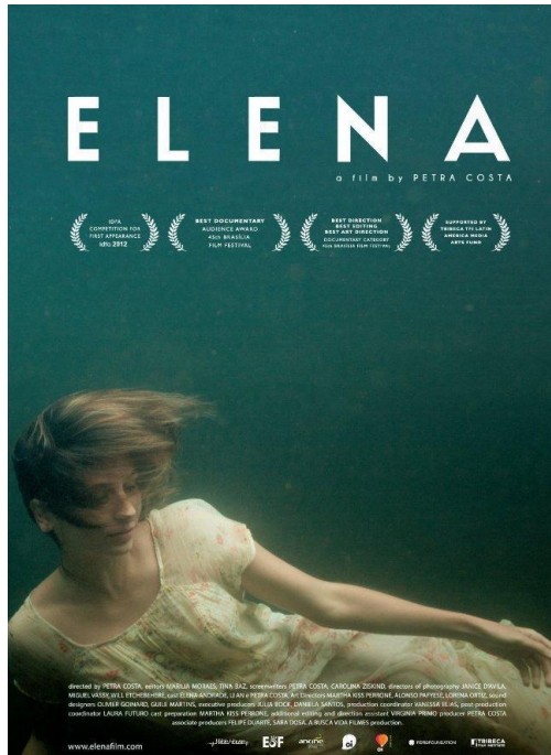
Afiche de Largometraje Documental “Elena”

Nota. Adaptado de Afiche Película Elena, Petra Costa,