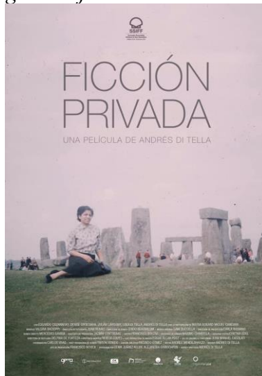
Afiche de Largometraje Documental “Ficción Privada”

Nota. Adaptado de Afiche Película Ficción Privada, Andres Di Tela,