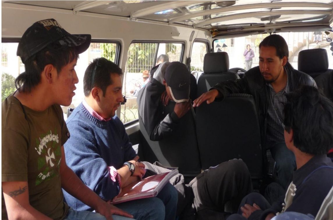
Intervención grupal en el Centro de Desarrollo Integral