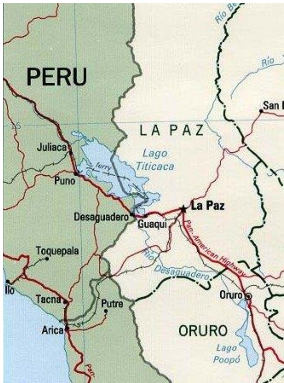
Anexo N° 1 Mapa del Departamento de La Paz. La Población del Desaguadero