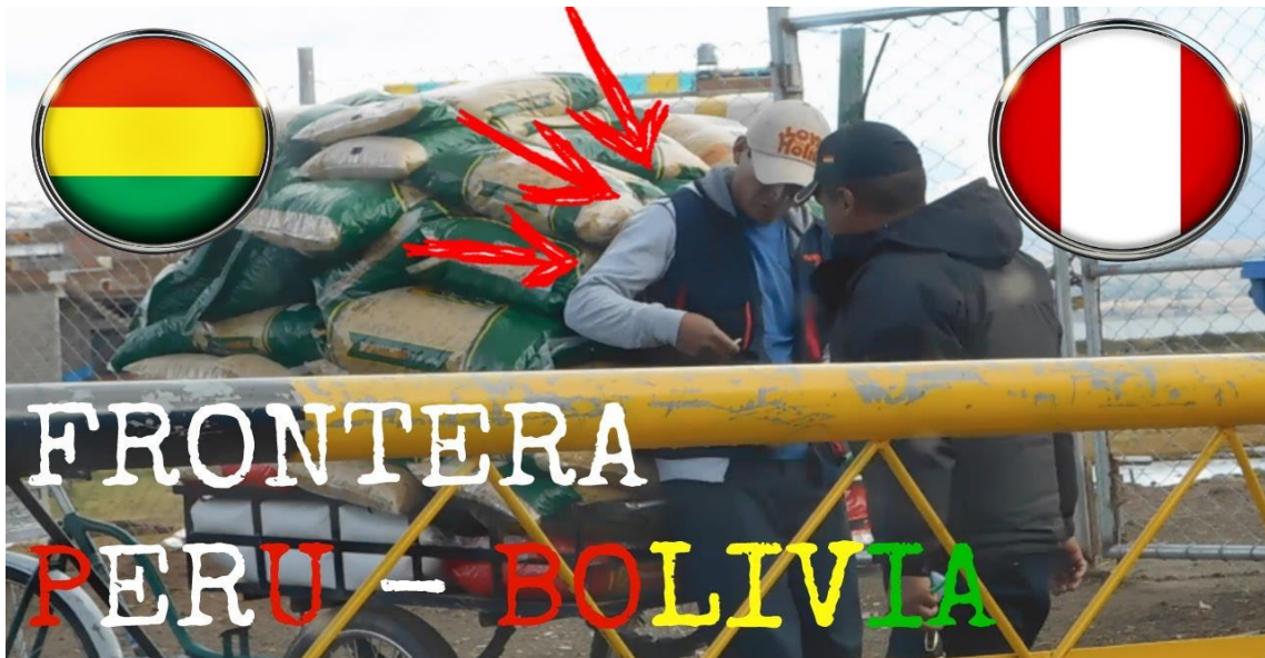
Imagen N° 2 Recaudación de mercadería incautada