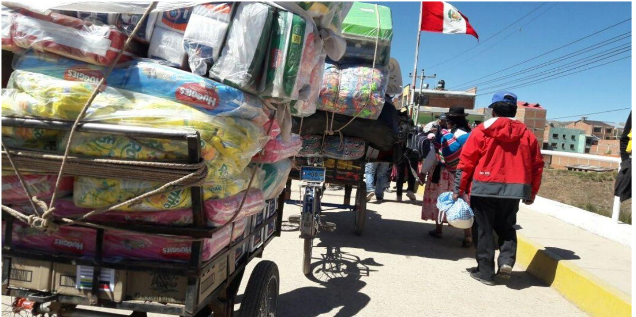
Imagen N° 4 Frontera Perú y Bolivia