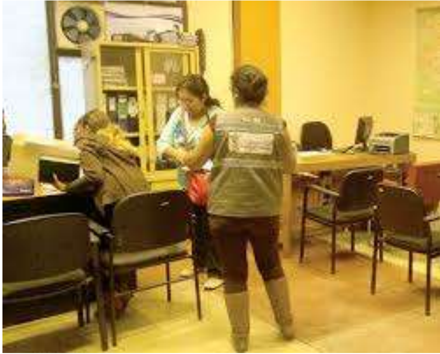
PRESENTACIÓN DE LA DEMANDA DE ASISTENCIA FAMILIAR