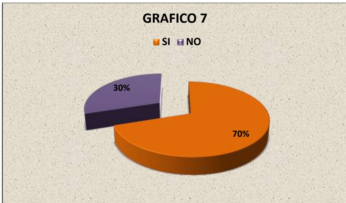
Grafico 7.: CONOCER SI LAS PERSONAS QUE NECESITAN LA ASISTENCIA FAMILIAR PARA SUS HIJOS HACEN TODA LA TRAMITACIÓN PARA RECIBIR ESTA OBLIGACION.