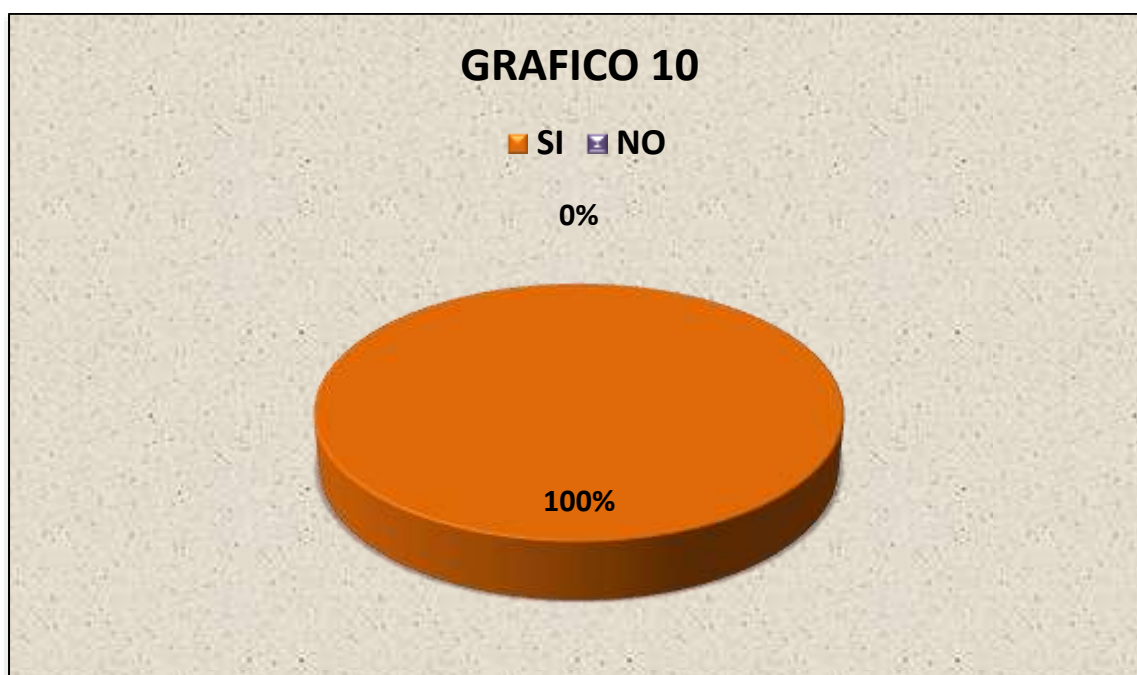
Grafico 10.: CONOCER SI LAS PERSONAS QUE NECESITAN LA ASISTENCIA FAMILIAR PARA SUS HIJOS ESTÁN DE ACUERDO EN PROPONER UN MECANISMO JURÍDICO PARA LA DESFORMALIZACIÓN DE LA ASISTENCIA FAMILIAR.