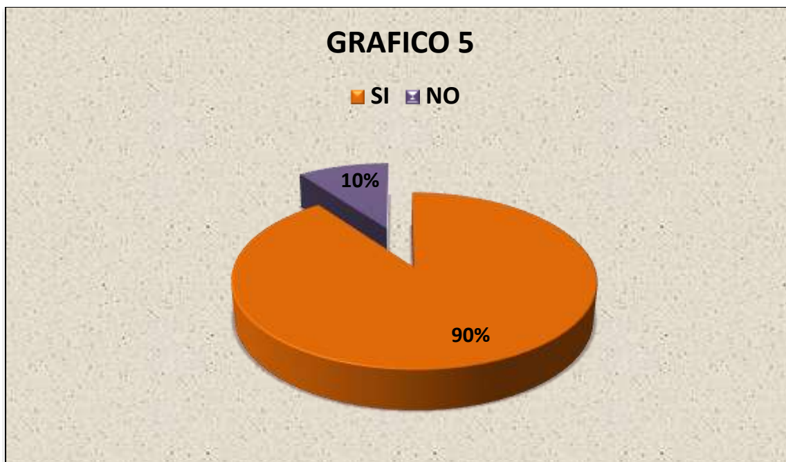
Grafico 5.: DERECHO A LA ASISTENCIA FAMILIAR QUE TIENE LOS HIJOS DE SUS PADRES