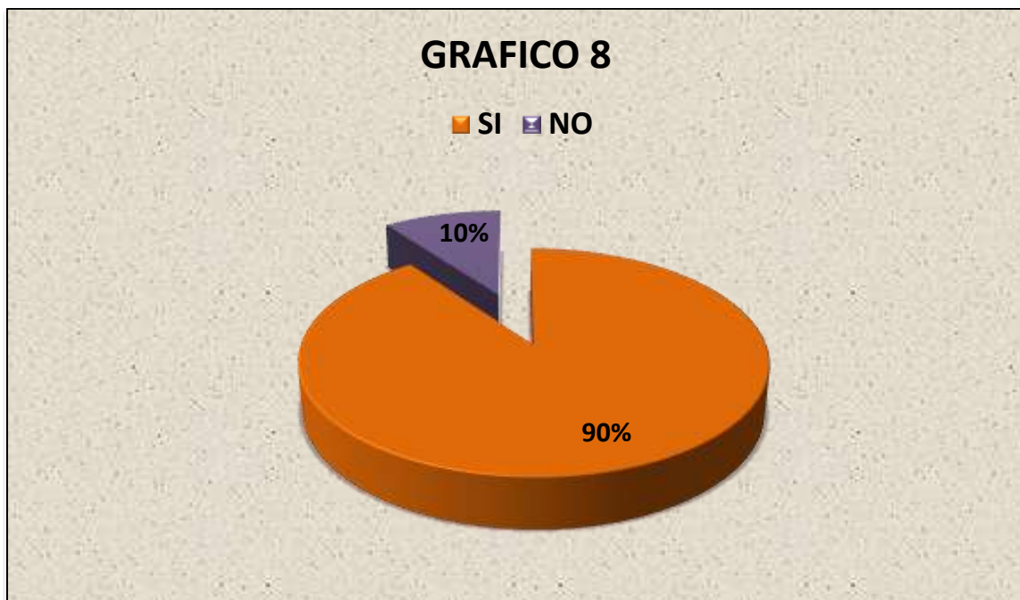
Grafico 8.: CONOCER SI LAS PERSONAS QUE NECESITAN LA ASISTENCIA FAMILIAR PARA SUS HIJOS ESTÁN DE ACUERDO EN QUE LA TRAMITACIÓN PARA ESTE ES UN PROCESO BUROCRÁTICO Y MOROSO.