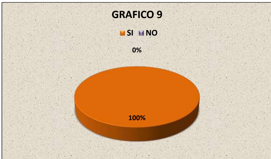
Grafico 9.: CONOCER SI LAS PERSONAS QUE NECESITAN LA ASISTENCIA FAMILIAR PARA SUS HIJOS ESTÁN DE ACUERDO UN CAMBIO EN LAS NORMAS Y LOS PROCEDIMIENTOS PARA LA CANCELACIÓN DE ESTA OBLIGACIÓN.