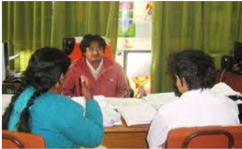
AUDIENCIA DE ASISTENCIA FAMILIAR