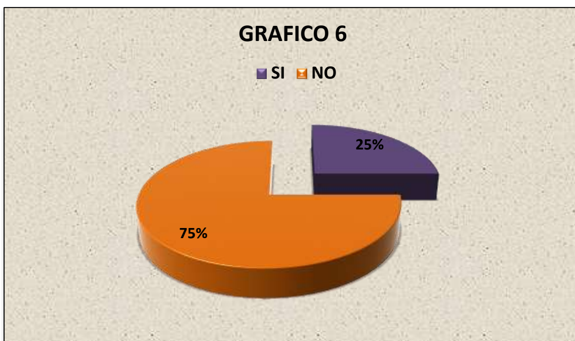
Grafico 6.: CONOCER CUANTAS PERSONAS RECIBEN ASISTENCIA FAMILIAR