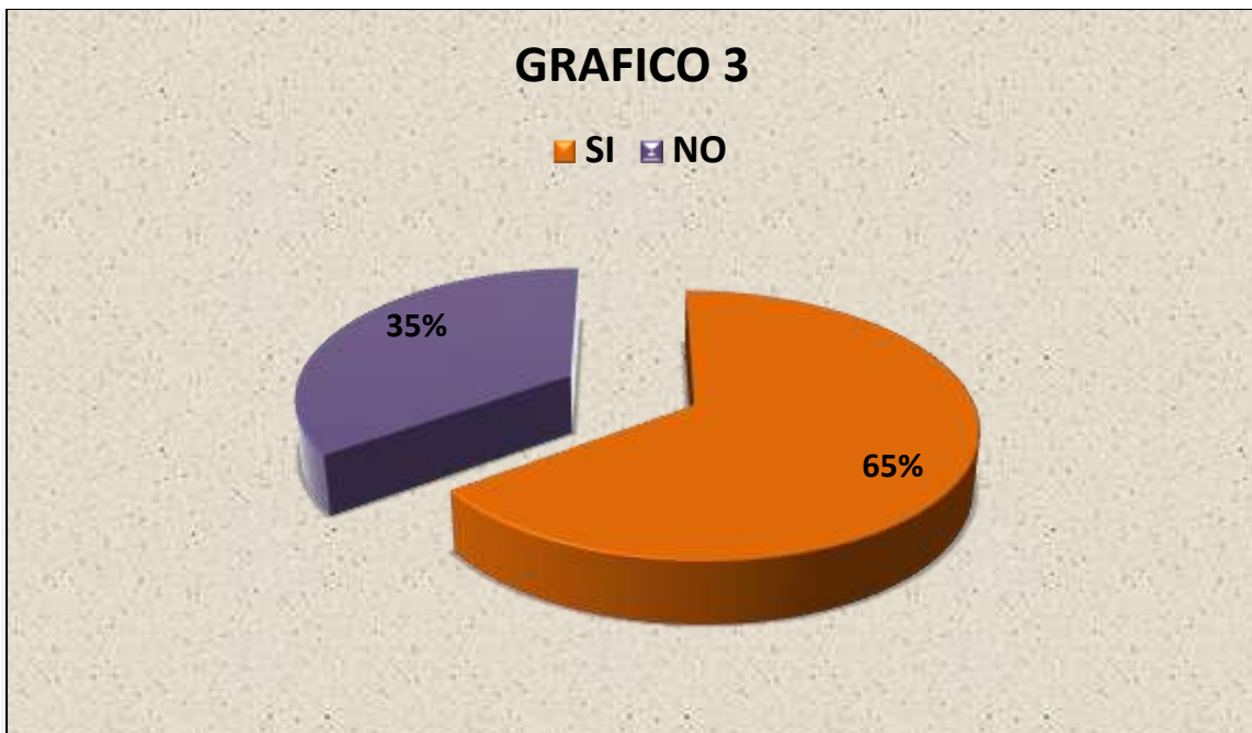
Grafico 3.: CANTIDAD DE PERSONAS QUE TRABAJAN O NO