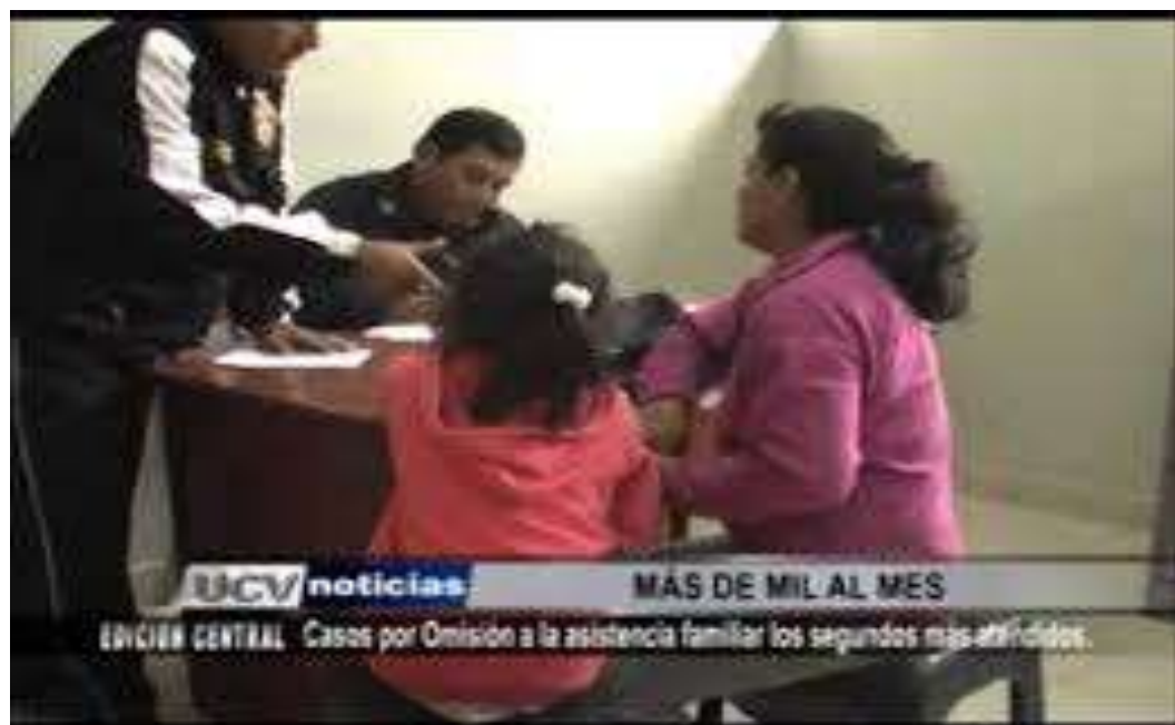
DENUNCIA POR OMISIÓN ASISTENCIA FAMILIAR