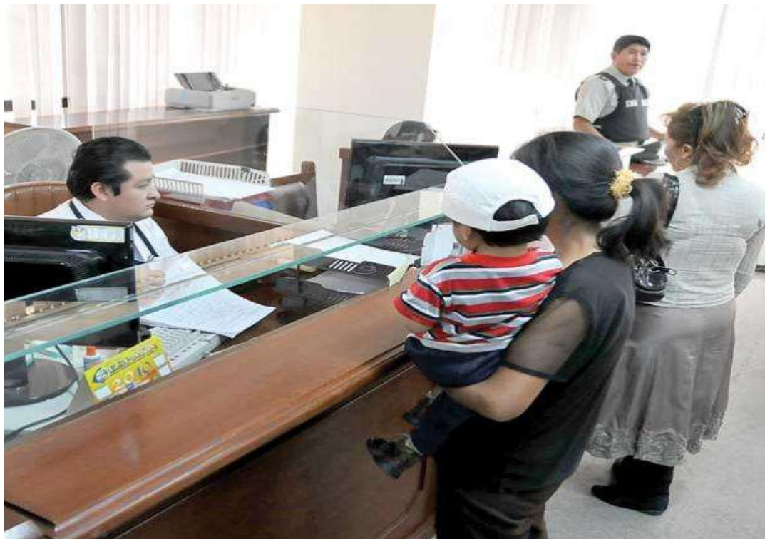
COBRO DE LA ASISTENCIA FAMILIAR