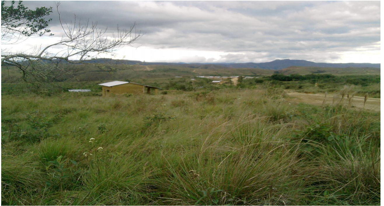
Esta es la comunidad de Machúa, cómo se observa en la fotografía