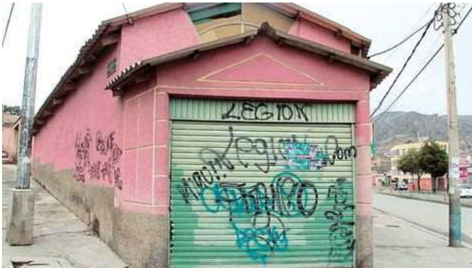
Lugar. En el garaje de esta casa, sobre la Calle 37 en Cota Cota, se observan graffitis de La Legión.

Miedo. El transporte público urbano es escaso de noche y hasta las tiendas cierran temprano