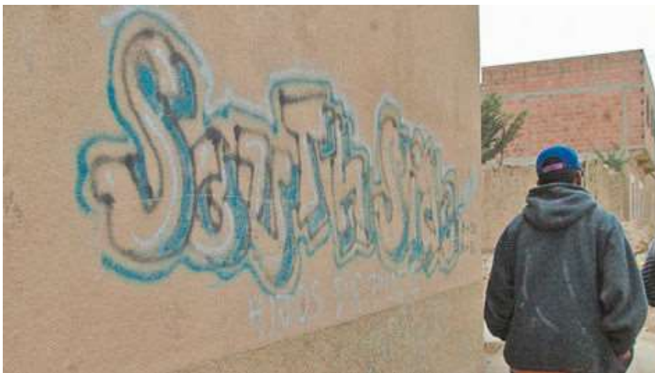
Territorio. Los graffitis marcan el lugar donde opera la pandilla.

Entre el 2008 y el 2010, el número de pandillas juveniles en la zona Sur de La Paz se duplicó debido a fracturas y peleas internas. Si antes habían siete, hoy son 15 los grupos que operan entre Obrajes y Ovejuyo.