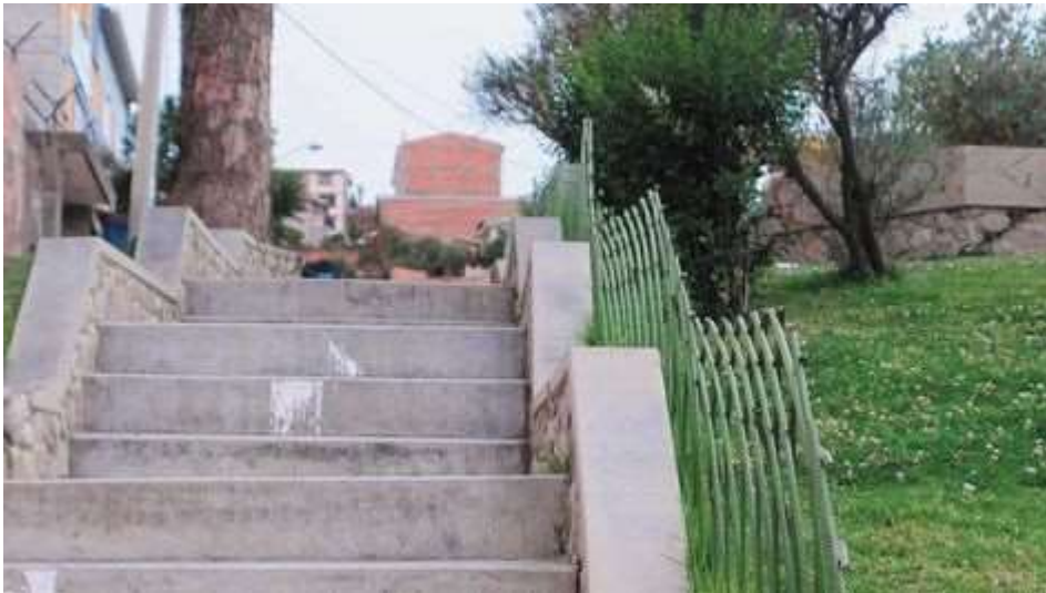
Cota Cota. El cadáver de Sally fue encontrado en estas gradas de la zona.

Crimen. Su símbolo era una cruz roja y estaba cerca del cadáver