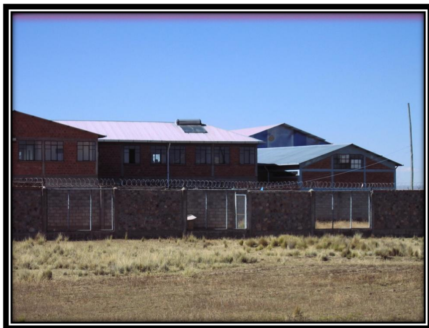
VISTA DESDE LA PARTE EXTERIOR DEL COMEDOR Y SALAS DE ESTUDIO