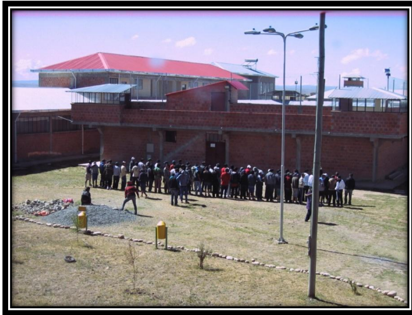
HORARIO DE FORMACIÓN DE JOVENES Y ADOLESCENTES INTERNO