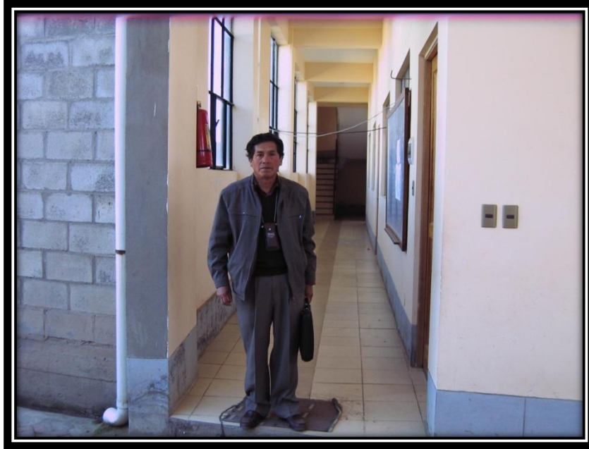
VISITA AL INTERIOR DEL CENTRO DE QALAUMA