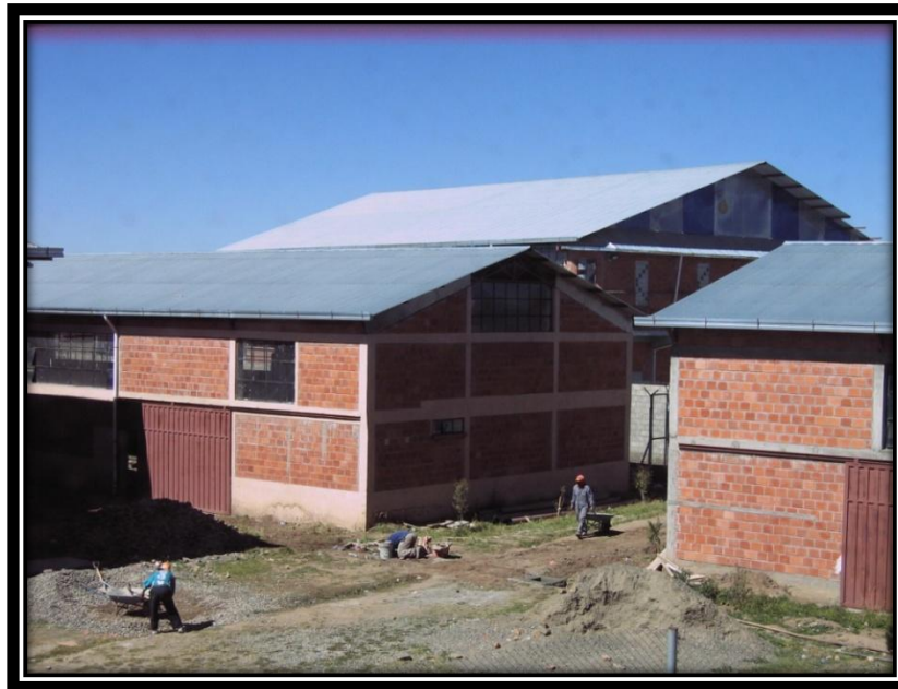
SALAS DE ESTUDIOS Y AMBIENTES DE LOS TALLERES