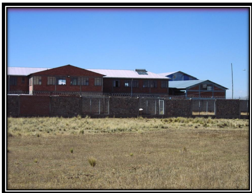
VISTA DESDE LA PARTE EXTERIOR DE LOS DORMITORIOS