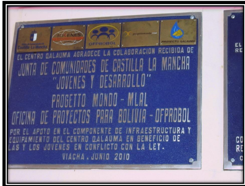
PLAQUETAS DE INSTITUCIONES DE APOYO