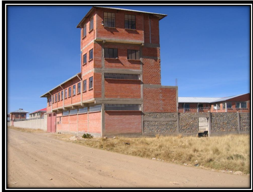
VISTA EXTERIOR DEL CENTRO DE REHABILITACIÓN DE ADOLESCENTES Y JÓVENES “QALAUMA”