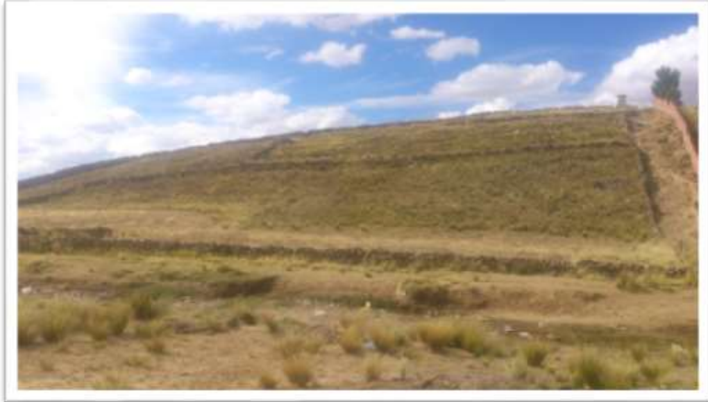
Imagen advierte el parcelamiento de los terrenos