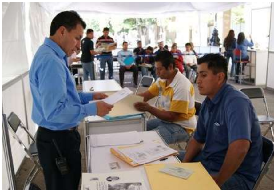
Fotografía: la falta de empleo de trabajo en Bolivia.

Esto significa, según el estudio, que el aumento constante de la población desocupada – más de 360 mil personas cesantes y aspirantes – va aparejado de una oferta reducida de puestos de trabajo calificado sin cobertura de la prestaciones de salud y seguridad social 34 .