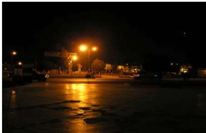
Fuente 59 : Espacio Inseguro (Plaza Sebastián Pagador) Ciudad Satélite.

Todo este panorama detallado nos muestra una desoladora realidad en que viven las familias en el Alto de La Paz, en total inseguridad por cuanto no existen la cantidad suficiente de policías por el gran crecimiento demográfico de esta urbe, que plantea la necesidad de que los encargados de resguardar la seguridad tengan que utilizar motorizados para desplazarse de un lugar a otro de manera inmediata, y no como ocurre en el presente que al llamado de auxilio de los vecinos ante la comisión de un hecho delictivo la policía llega después de que ha pasado ya todo y los delincuentes han huido.