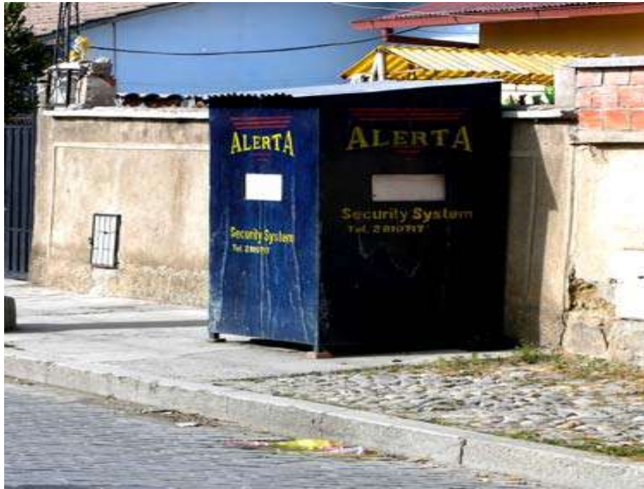
Fuente 64 : Caseta de Seguridad Privada. www.pieb.org/seguridadciudadana/archivos/publicacion.pdf

La información en la época actual se ha transformado en un bien público perfecto para la democracia, que la autoridad pública tiene la obligación de asegurar, tanto en cantidad y calidad, como en su equitativa distribución social. Una sociedad que vive el miedo cotidiano de la delincuencia, se hace más temerosa mientras más desinformada está, hoy existen las redes sociales que fácilmente pueden utilizarse para información, así como hay teléfonos inteligentes que pueden conectarse a las alarmas vecinales. La incertidumbre, es el factor fundamental de la llamada dimensión subjetiva de la seguridad ciudadana puede ser tan aterradora como la violencia misma. Y una sociedad dominada por el miedo es una sociedad que termina por legitimar la violencia y la delincuencia.