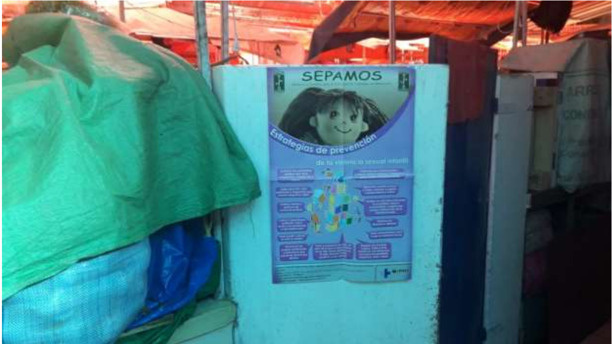
Exposición de muñeco de nieve con estrategia de prevención