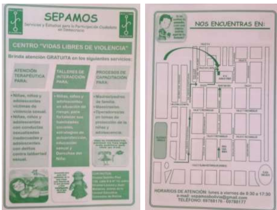
IMAGEN N° 2

La primera actividad fue realizada en fecha 02 de octubre de 2019, estuvo orientada a informar y explicar acerca del trabajo que realiza la ONG SEPAMOS y el programa de protección y Prevención Integral a Niños Niñas y Adolescentes en Situación de violencia Sexual “Vidas libres de violencia”. Para este propósito se distribuyó trípticos informativos de la institución, como se observa.