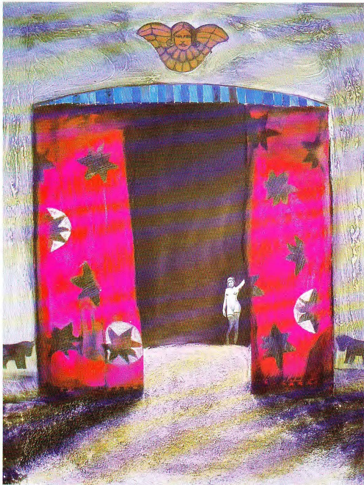
Gran entrada técnica mixta 120 X 160 cm. 1999