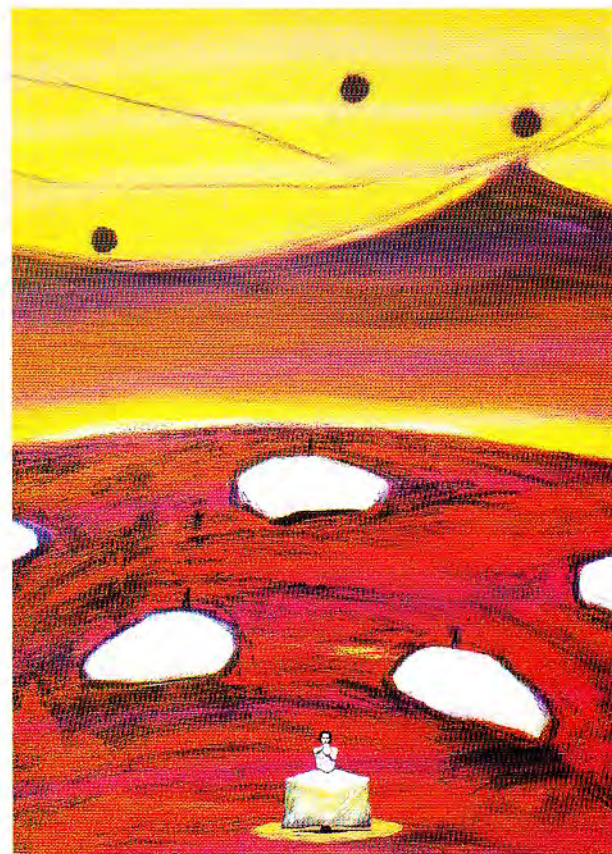
Gran telón técnica mixta 120 X 160 cm. 1999