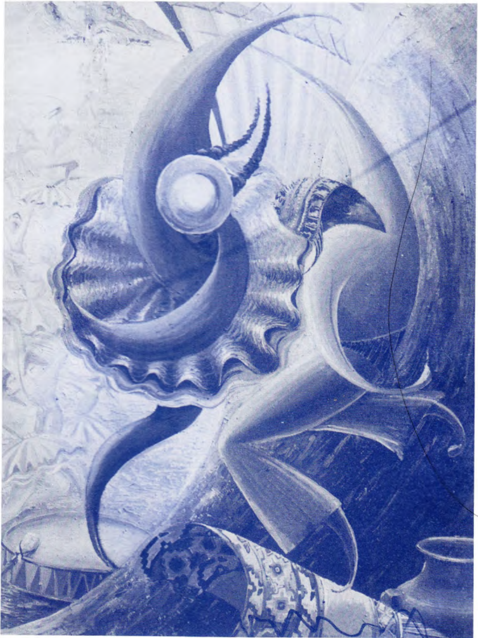
LA ELEGIDA DE LOS DIOS