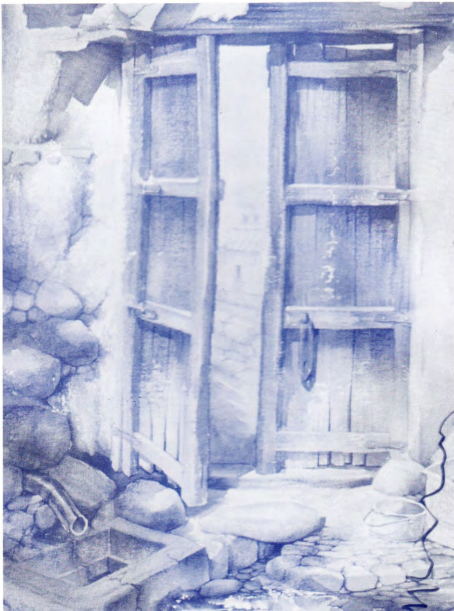
PAISAJE POTOSINO, PORTON