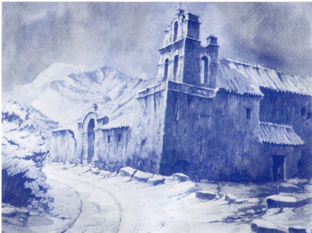
DESPUES DE LA TORMENTA