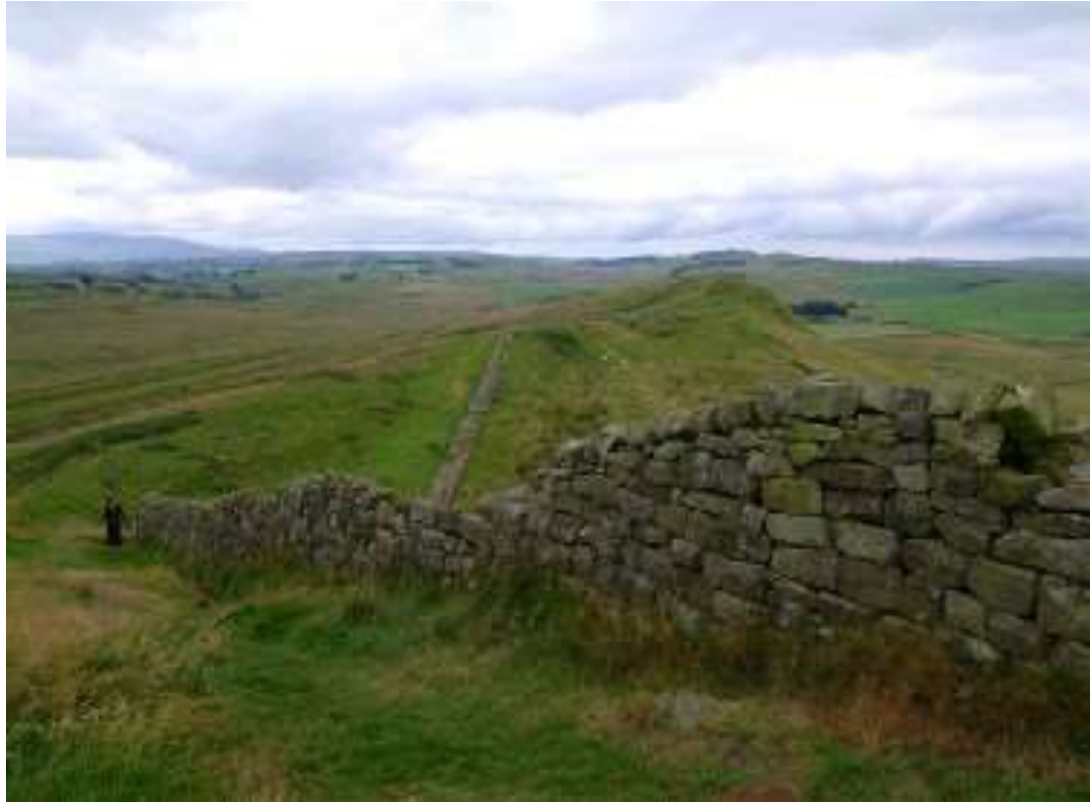
Limes romano: muro de Adriano en Greenhead (Gran Bretaña)

Según los arqueólogos e historiadores la fortificación de los limes romanos pudo haber sido influida por la idea de la Gran Muralla china, aunque las dos grandes construcciones estén geográficamente muy alejadas entre sí.