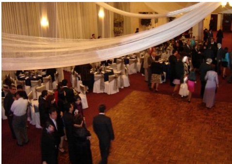
Imagen del local de Círculo Aeronáutico en los Pinos en donde se realizó un matrimonio. Fecha: 21-09-13.

En los ambientes en donde desarrollan fiestas, como por ejemplo: un matrimonio, existen detalles que comúnmente no se observa en las fiestas de los sectores populares. Puesto que empezando del piso, es machimbrado y destinado como pista de baile y alrededor se encuentra alfombrado como espacio destinado a las mesas para los invitados. Los arreglos de las mesas también tienen una decoración pormenorizada, ya que la cuestión de la estética es parte de su estilo de vida que tienen. La siguiente imagen refleja lo descrito.