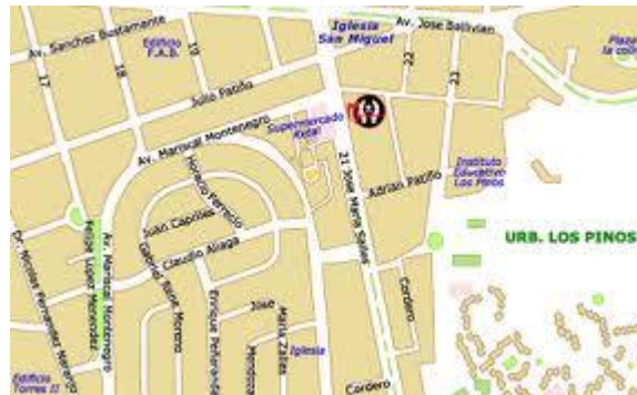
Plano de algunas principales zonas: Fuente INE