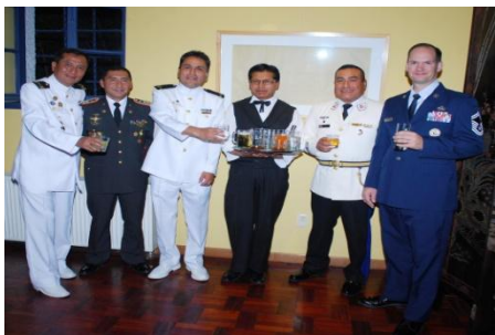
Imagen de un acontecimiento realizado por Augusto Sánchez Valle. Fecha: 15-08-13