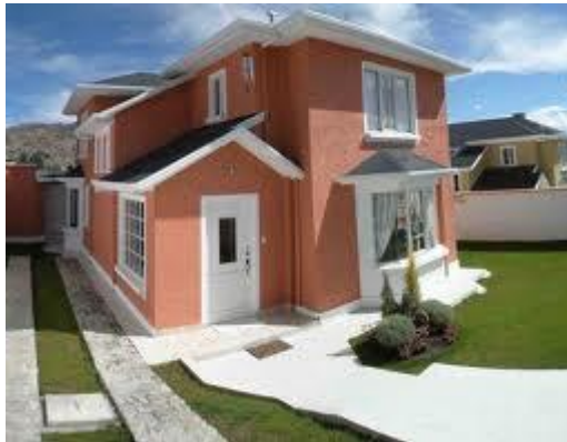
Foto de una vivienda en la Zona Sur

Las nuevas construcciones responden a la eficiencia del espacio y la expansión de esta población de elite con edificaciones de departamentos y condominios donde el espacio es bastante amplio con sus respectivos jardines plantas y otros detalles arquitectónicos modelo europeo: