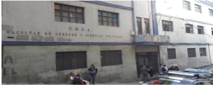
Ingreso a la Facultad de Derecho y Ciencia Política de la UMSA.