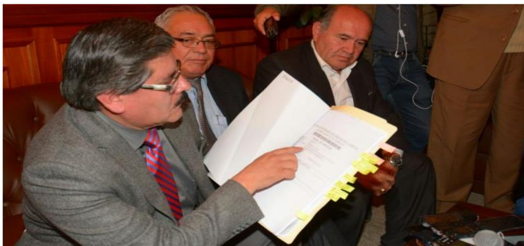
El rector de la UMSA, Waldo Albarracín.