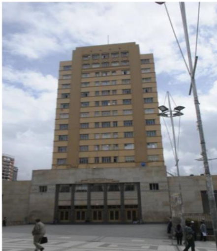
El Monoblock de la UMSA, en la avenida Villazón de La Paz.