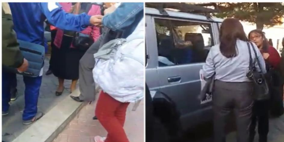
Captura de pantalla de un video en que se observa a los menores siendo ingresados a un vehículo.