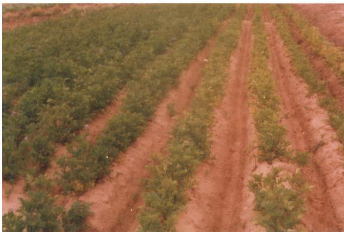
Foto 2 La Siembra de la papa

Para la siembra de la papa los habitantes aplican el sistema de conocimientos propios basado en observaciones y experiencias.