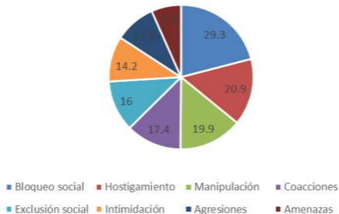
Tipos de Acoso Escolar